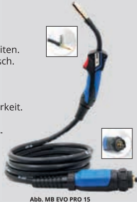
Abb. MB EVO PRO 15